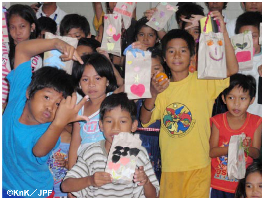
心理社会的ケアの一環でバッグを作る子どもたち