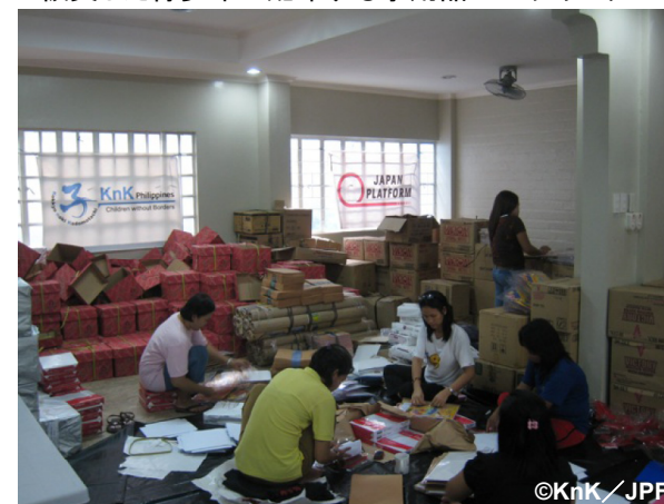
被災した青少年に配布する学用品のパッキング