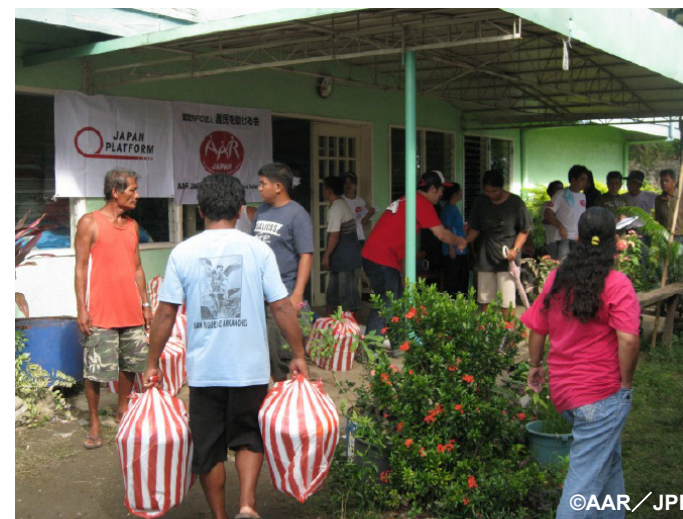
緊急支援物資(食料、寝具セット)を配布するADRAスタッフ達