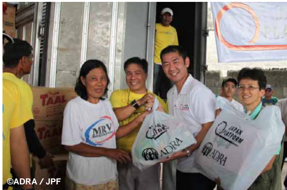
食料と寝具のセットを配布