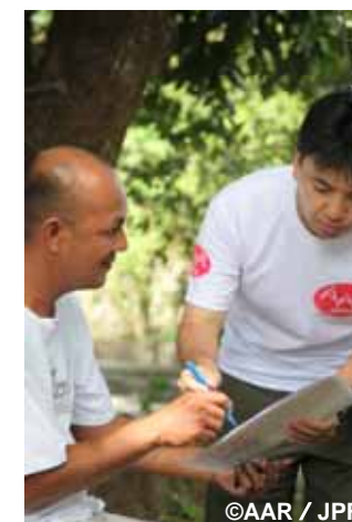
配布先の事前調査をするNGOスタッフ