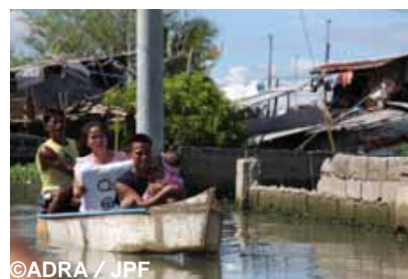
浸水している我が家へ帰る被災者