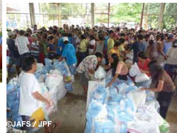
住民の名簿を確認しながら物資を配給する