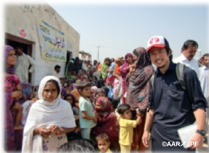
診療所で順番を待つ人々と日本人スタッフ (ムザファルガル郡)