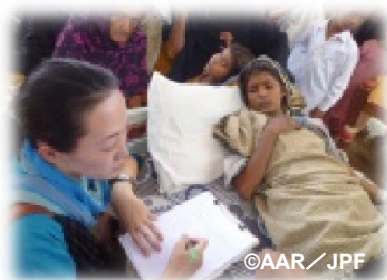
下痢と熱、頭痛が止まらず診療所に来た人に話を聞く日本人スタッフ (ムザファルガル郡)