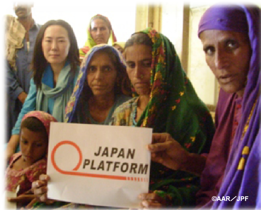
巡回診療チームが訪問した学校にて(スッカー郡)