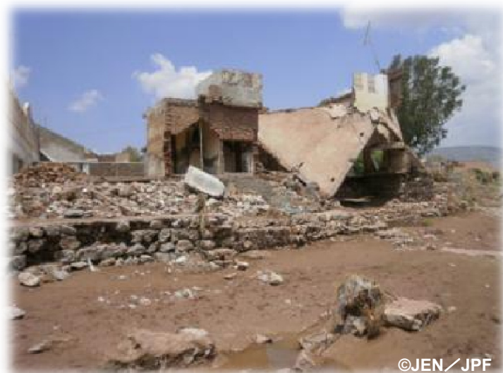
被災した家屋(コハーム県ガムバット村)