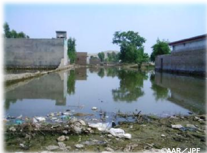
いたるところに残る水たまり(ノウシエラ郡)