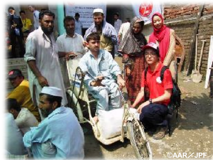
とりわけ障害者は厳しい状況に置かれています