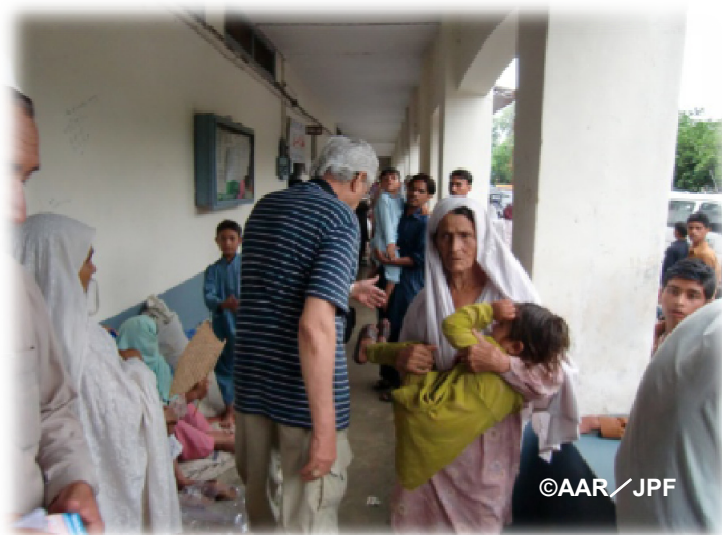
患者でいっぱいのノシエラ郡の臨時診療所