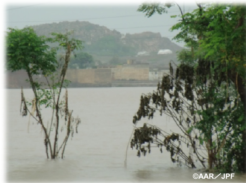
洪水のため耕作地も水浸しになったノシエラ郡の様子