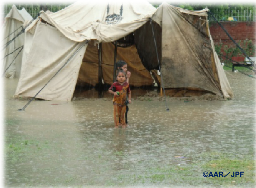
臨時診療所内でテント生活をおくる被災した子どもたち