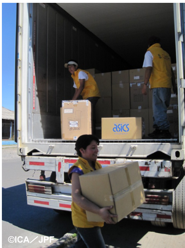
スポーツウェア搬入の様子