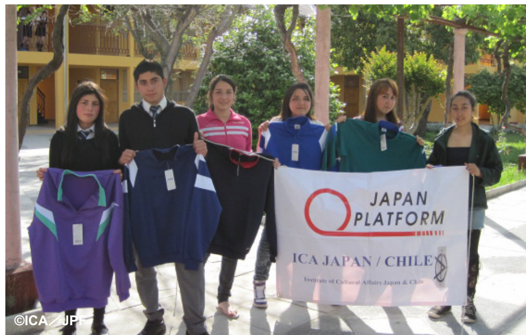
アシックスのスポーツウェア19,216枚が 中学生たちの手に届きました