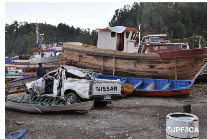
活動地(コンセプション)は津波の深刻な被害を受けた地域