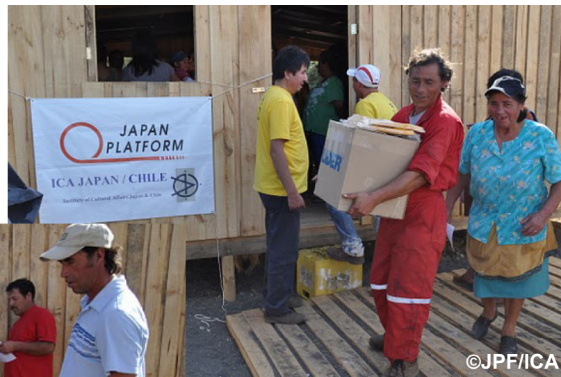
物資を受け取る漁業地域の被災者の方々