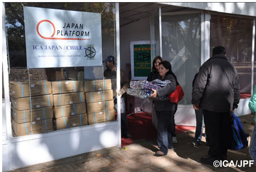
冬に備えて毛布の配布