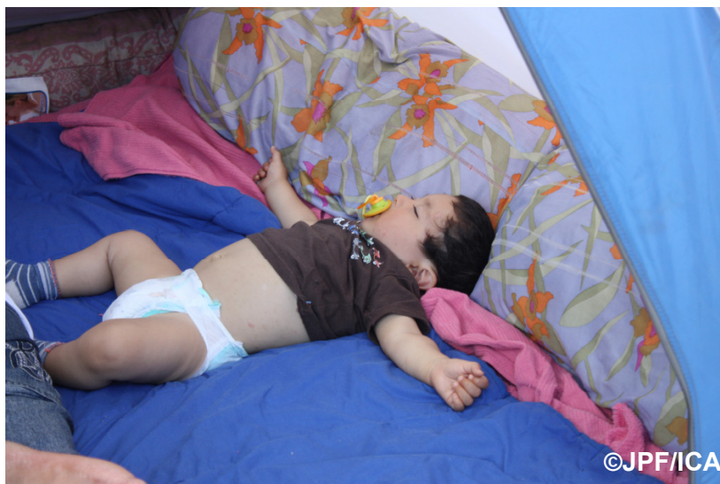
避難先のテント内で眠る赤ちゃん