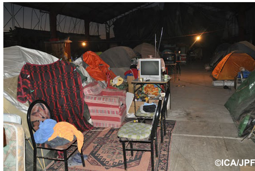
タルカでの被災生活の様子