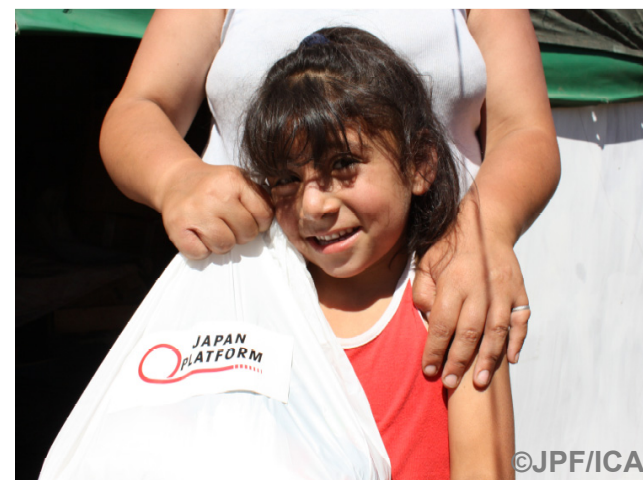
物資を受け取った母親の前ではかむ少女