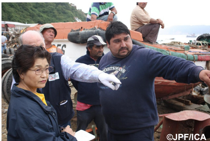
コンセプションにおける聞き取り調査