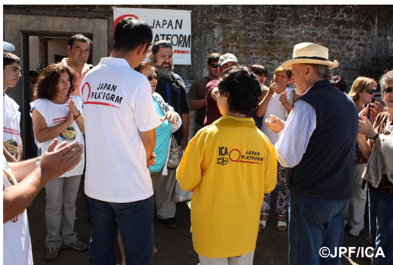
日本の皆さまからJPFへサポートをいただき、物資配布活動を実施していると説明。被災者の方々から感謝の拍手を受ける