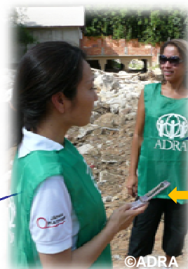
通信機器は必須。 ソフトバンクのサポートにより、 携帯電話を持って現場入り