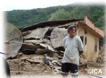
倒壊した家の前で支援を求める村人