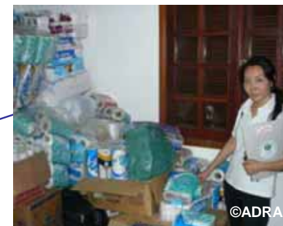
支援物資の調達を進めるNGOスタッフ (現地協力団体の物資とともに)

被災した900世帯へ、 鍋などの調理器具セット、 タオルやシーツのセットを 配付する予定