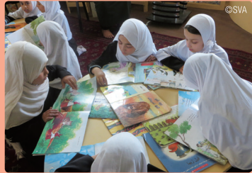
အာဖရိကန်နစ္စတန်နှင့် ဝါကစ္စတန် လူသားချင်းစာနာမှုဆိုင်ရာ အကူအညီပေးခြင်း

ဂျပန်ပလက်ဖောင်း အဖွဲ့အစည်းသည် ဂျပန်နိုင်ငံမှ နိုင်ငံတကာသို့ လူသားချင်းစာနာထောက်ပံ့သော အကူအညီပေးရေး အဖွဲ့အစည်း တစ်ခုဖြစ်ပြီး ၂၀၀၀ ခုနှစ်တွင် ဂျပန် အန်ဂျီအိုများ၏ အရေးပေါ် ကယ်ဆယ်ရေးနှင့် လူသားခြင်းစာနာ ထောက်ပံ့သော အကူအညီပေးရေး အတွက် စနစ်တစ်ခုအနေဖြင့် တည်ထောင်ထားသော အဖွဲ့အစည်း ဖြစ်ပါသည်။ ဂျပန်ပလက်ဖောင်း အဖွဲ့အစည်းသည် ကူညီသော မိတ်ဖက် အဖွဲ့အစည်းများအဖြစ် ဂျပန်ပြည်သူလူထု၊ အစိုးရအဖွဲ့အစည်း၊ စီးပွားရေး လုပ်ငန်းရှင်များ၊ အုပ်စုနှင့်အတူ ရည်ရွယ်ချက် အစီအစဉ်ကောင်းများကို ဆောင်ရွက်လာပြီး၊ ကမ္ဘာတစ်လွှား၌ ဖြစ်ပျက်နေသော သဘာဝ ဘေးအန္တရာယ်နှင့် ပဋိပက္ခအခြေအနေများကို တုံ့ပြန်ပေးမည့် အရေးပေါ် ကယ်ဆယ်ရေးနှင့် လူသားချင်း စာနာထောက်ထားသော ပံ့ပိုးကူညီမှုများကို မိတ်ဖက် အဖွဲ့အစည်းများမှတစ်ဆင့် အချိန်မီ ထိရောက်စွာ ကူညီပေးနိုင်ရန် စီစဉ်ထားသော အစီအစဉ်ကောင်း တစ်ခု ဖြစ်ပါသည်။ ကျွန်ုပ်တို့၏ စွမ်းဆောင်နိုင်မှုအတွင်း ပြင်းပြသော ရည်ရွယ်ချက်မှာ အဖွဲ့ဝင် အန်ဂျီအိုများ၏ အတွေ့အကြုံနှင့် ကိုယ်ရည်ကိုယ်သွေးကို အင်အားတစ်ရပ်အဖြစ် ပြည့်ဝစွာ အသုံးပြုပြီး ဆောင်ရွက်မှု ကဏ္ဍ တစ်ခုချင်းစီအလိုက် အင်တိုက်အားတိုက် ကြိုးပမ်းစွာ ပါဝင်ဆောင်ရွက် မှုကို ရရှိရန် ဖြစ်ပါသည်။ ၂၀၀၀ ခုနှစ် အစောပိုင်းကာလကပင် နိုင်ငံပေါင်း (၄၀) ကျော်ရှိ ဒေသများ၌ ခန့်မှန်းငွေကြေး အမေရိကန်ဒေါ်လာ သန်း ၃၅၀ ဖြင့် စီမံကိန်းပေါင်း (၁၁၀၀) ကျော် အကောင် အထည်ဖော် ဆောင်ရွက်ခဲ့ပြီး ဖြစ်ပါသည်။ ၂၀၁၅ခုနှစ် ဇွန်လအထိ ဂျပန်ပလက်ဖောင်းအဖွဲ့အစည်းသည် အဖွဲ့ဝင် အန်ဂျီအိုပေါင်း (၄၇) ဖွဲ့ဖြင့် ပူးပေါင်းလုပ်ဆောင်လျက် ရှိပါသည်။