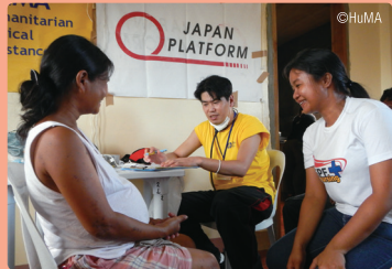
ဖိလစ်ပိုင် ဟာဂူပစ် မုန်တိုင်း အရေးပေါ် တုံ့ပြန်မှု