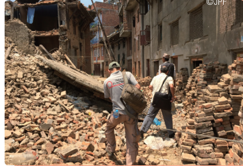
နီပေါ မြေငလျင် အရေးပေါ် တုံ့ပြန်မှု