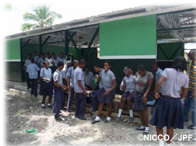
仮設校舎を建設し、授業再開を支援。

清潔な水が飲めるだけでなく、排水溝を作って澱みをなくし、蚊が媒介する病気の感染リスクも軽減する仕組みです。以前あった井戸を取り換えるだけでなく、衛生環境の改善にも取り組んでいます。