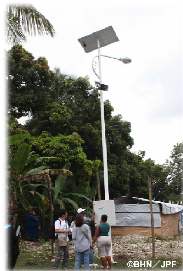
防災無線システムを設置。

また、日本人の建築・大工の専門家を派遣し、校舎建設を通じて、現地へ耐震に関する技術移転も行いました。