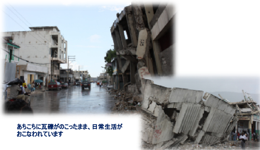
あちこちに瓦礫がのこったまま、日常生活がおこなわれています