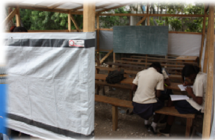
学校が子どもたちに与えてくれるものは、知識だけではありません。子どもたちの“居場所”としての大切や役割も果たします。