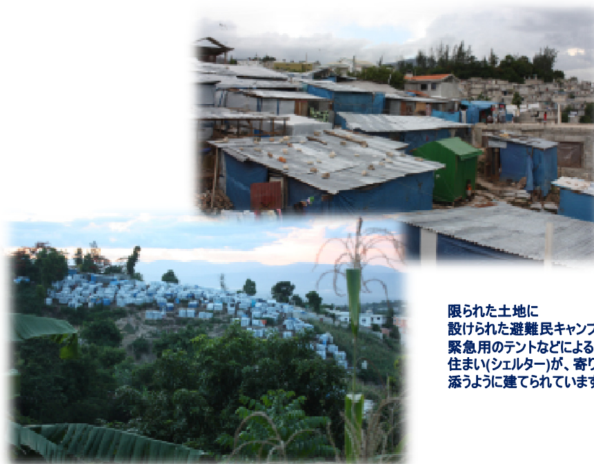
限られた土地に設けられた避難民キャンプ。緊急用のテントなどによる住まい(シェルター)が、寄り添うように建てられています