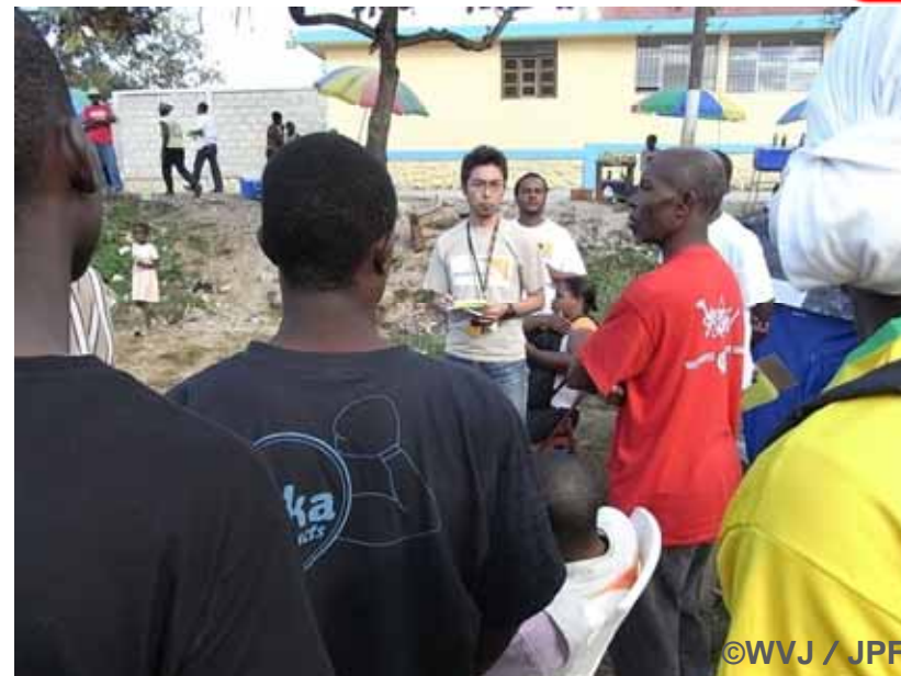
避難キャンプで被災者からの聞き取り調査を行うWWJスタッフ