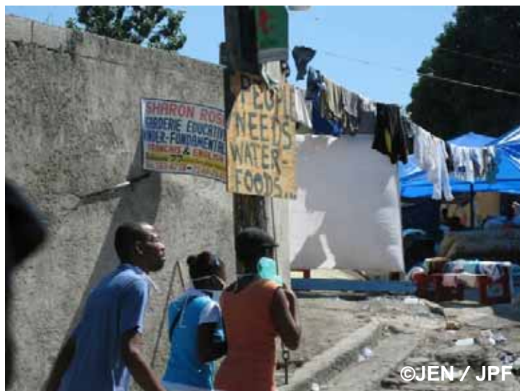
街の至る所に支援を求める貼紙がある