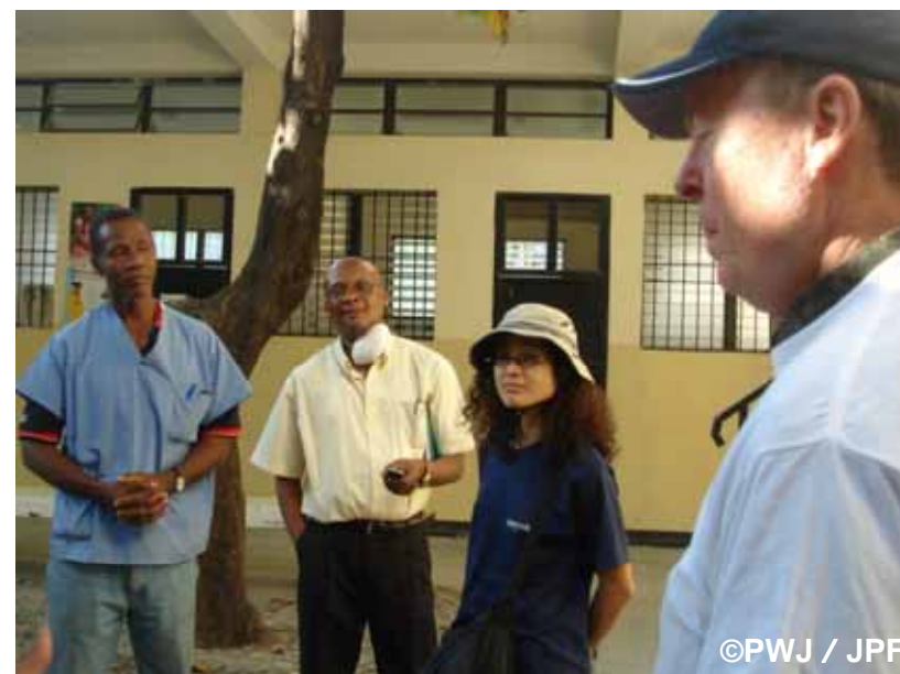
調査中のPWJスタッフ