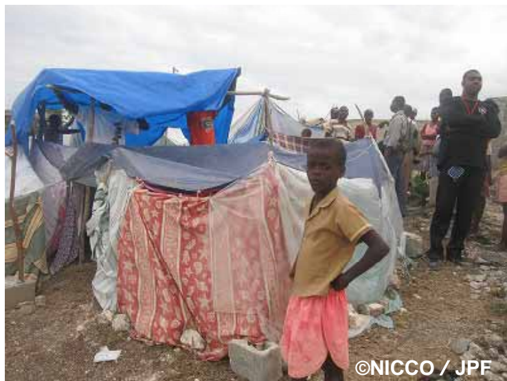
木や布で作った小屋に住む被災者