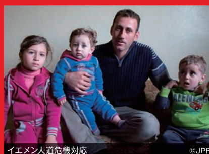
イエメン人道危機対応