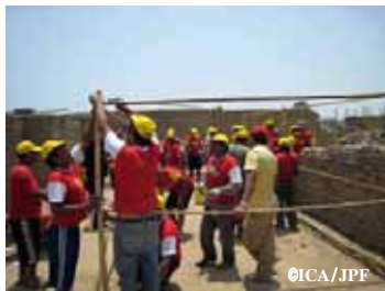
シェルターの作り方を学ぶリーダー