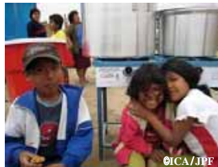
ガスコンロ、大鍋、お玉などを炊出し所に配布

ICA チンチャ市郊外における緊急支援事業 コミュニティリーダー育成 - 121名 仮設住宅および仮設住宅用資材配布 - 3,450ヶ所 調理器具配布 - 122ヶ所の炊出し所 *上記は緊急1・2事業の合計成果