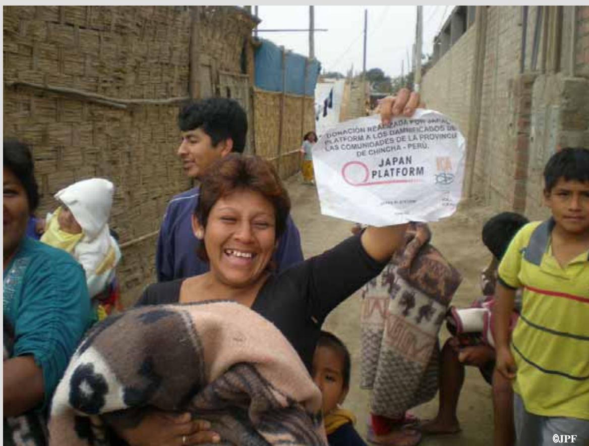
1年前に配布した毛布を今も使用している被災者：事業地チンチャアルタにおいて