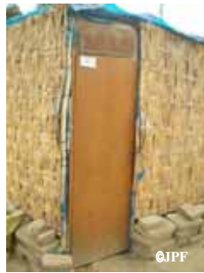
藁マット、防砂用ブルーシート、ドアの簡単なつくり