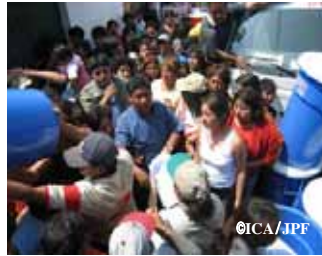
物資の配給を待つ被災者

毛布および飲料水用ポリタンク配布 (ICA) - 毛布 (全配布数1,200枚) - 水タンク (全配布数600個)