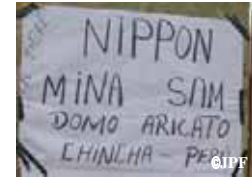
「にっぽん みなさん ども ありがと」