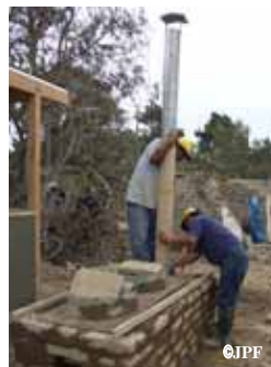
かまどの設置 大釜2個を設置でき熱効率が良い

コミュニティリーダーの育成 - 58名 共同キッチンにおけるエコ薪かまどの設置 - 320ヶ所 共同キッチンへの調理器具の配布 - 320ヶ所 コミュニティスペースの設置 - 6ヶ所