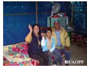
仮設住宅 (シェルター) 内部