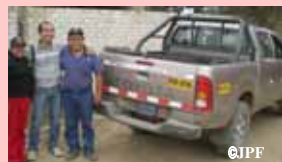
レンタル車とICAスタッフ (* )三井物産100%出資の子会社。トヨタ製車両・日野製トラックの小売販売・アフターサービス、トヨタ製車両レンタルなど

また、ICA文化事業協会(ICA)が発災後にチンチャルタで被災者支援事業を実施するに当たり、当社で扱っているトヨタのピックアップトラックをレンタルさせて頂きました。地球の反対側からペルーの被災者支援のために来てくれたことが嬉しかったことを覚えています。その後、ICAには1年以上に亘りレンタルを続けました。ICAはJPFの助成を受けて支援を行っていましたが、JPFの知名度はペルーでは低く、海外の邦人企業に積極的に存在をアピールする必要があると思います。被災国において支援活動をする際には当該国内において支援者となりうる邦人へのPRIは特に重要になるでしょう。