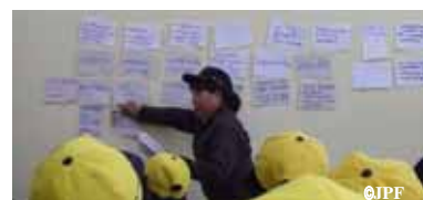
リーダーの定期会合 (経験などを共有する場として)

JPF ペルー地震被災者支援評価報告書作成事業 JPF ペルー地震被災者支援現地実態調査