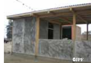
コミュニティスペース 伝統的なキンチャを建材に使用しており廉価で恒久住宅を建設できる キンチャの良さを見直してもらうために設置